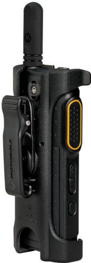
PMLN7190 佩戴固定装置/皮套， 带旋转皮带夹

在现场与客户进行大量的交流工作后，我们开发了各种配件。 这些配件不仅颇具创新性，而且极为实用。